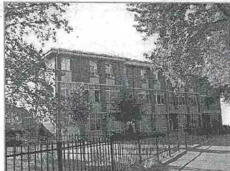
И НИШ ДОБИЈА ПАРК ЗНАЊА: пројекат Регионалног центра

уциона на отвореном са Галилејевим клатном, Архимедовим бележницом, Магнетним тунелом и Паскаловим тронем.